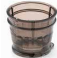
Сетка-фильтр для замороженных десертов