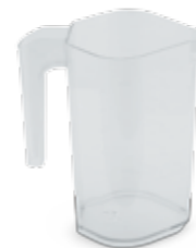
Емкость для сока