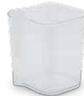
Контейнер для мякоти