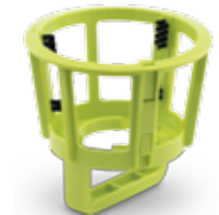
Щетка для чистки сетки-фильтра