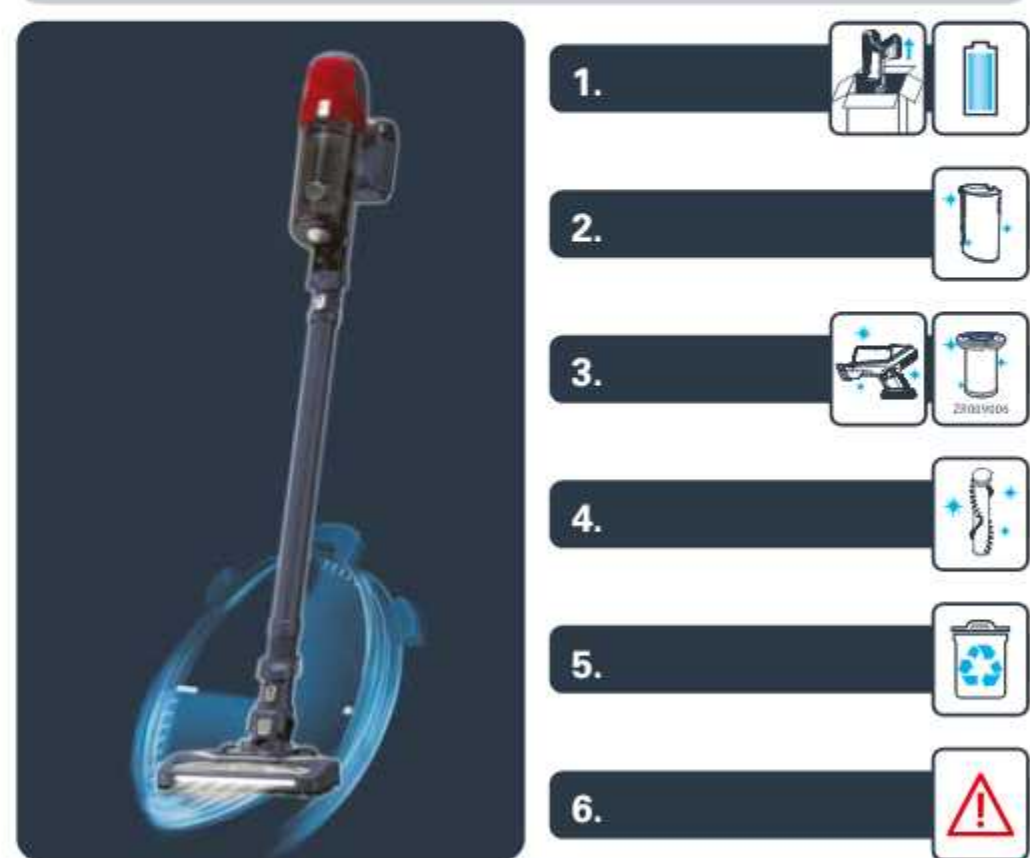
X-PERT 6.60 RH68/TY68/EO68

FR Guide de l'utilisateur EN User's guide DE Bedienungsanleitung NL Gebruiksaanwijzing ES Guía del usuario PT Guia de utilização IT Manuale d'uso EL Οδηγός χρήσης TR Kullanım kılavuzu CS Návod k použití SK Používateľská príručka HU Használati útmutató ET Kasutusjuhend LT Naudojotojo vadovas LV Lietošanas pamācība BG Ръководство на потребителя RO Ghidul utilizatorului SL Navodila za uporabnika HR Upute za uporabu BS Upute za upotrebu SR Uputstvo za upotrebu RU Руководство пользователя UK Посібник користувача CN 用户指南 HK 用戶指南 KO 사용자 가이드 AR دليل الاستعمال FA راهنمای کاربر FI Käyttöopas NO Brukermanual DA Brugermanual SU Användarmanual