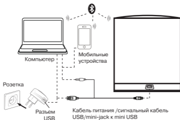
Рис. 2. Схема подключения