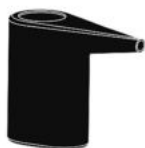
Стакан для воды