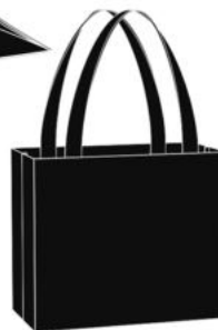
Сумка для принадлежностей

Индикатор горит красным цветом, когда пароочиститель нагревается. Когда пар достигает номинального давления — нагреватель выключается, а цвет индикатора сменяется на зеленый.