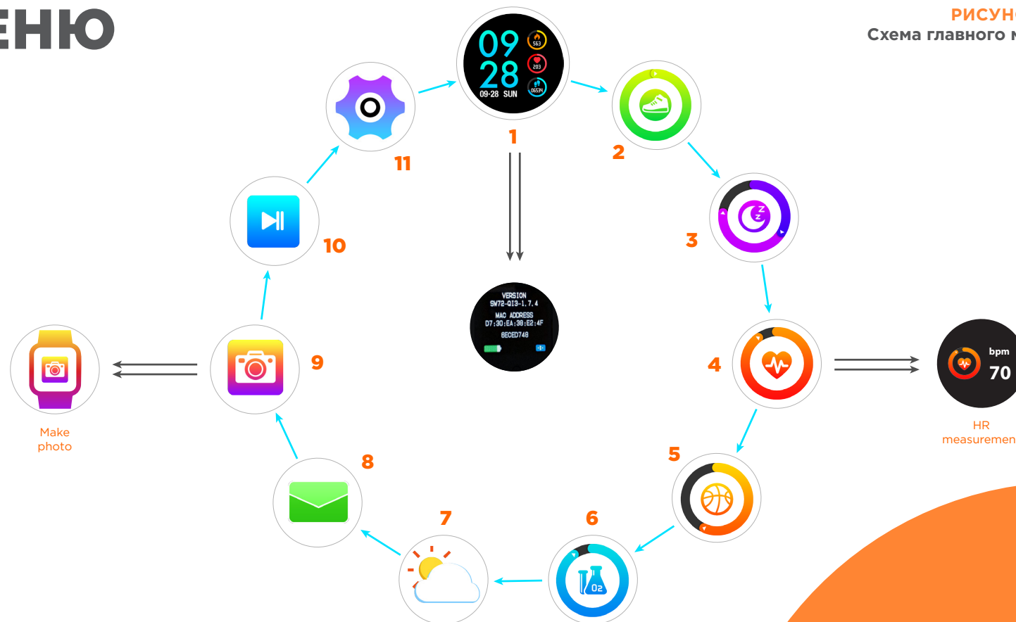
РИСУНОК 1. Схема главного меню

5. Спорт. Данный пункт меню является основным разделом для занятия различными видами спорта и отслеживания результатов. Для выбора вида тренировки и начала занятий нажмите и удерживайте сенсорную кнопку. Откроется подменю с разными видами тренировок. Схематично все подменю «Спорт» изображено на рисунке 2.