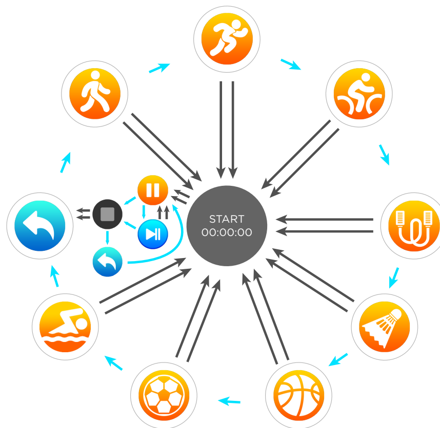
РИСУНОК 2. Подменю «Спорт»

При помощи коротких нажатий на сенсорную кнопку пользователь может выбрать вид спорта для тренировки.