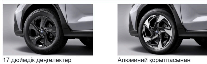
17 дюймдік дөңгелектер, Алюминий қорытпасынан жасалған 18 дюймдік дөңгелектер