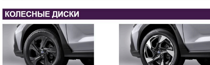
17-дюймовые колеса, 18-дюймовые сплава из алюминия