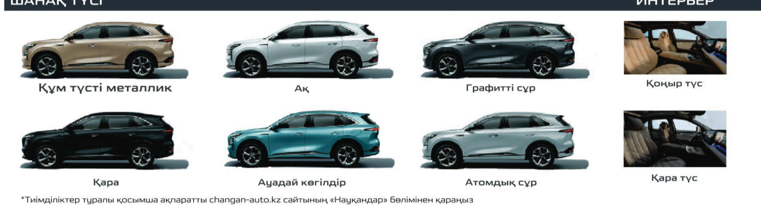
*Тімділіктер туралы қосымша ақпаратты changan-auto.kz сайтының «Науқандар» бөлімінен қараңыз