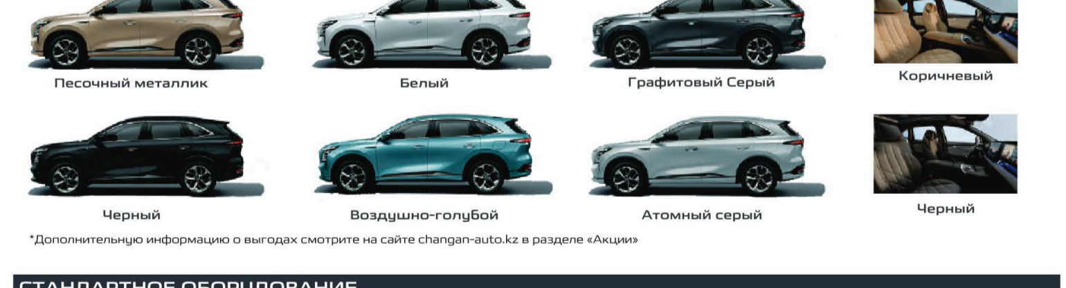
*Дополнительную информацию о выгодах смотрите на сайте changan-auto.kz в разделе «Акция»